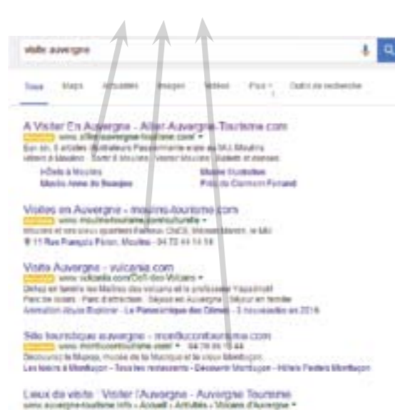
L'Allier monopolise le haut de page

présence soutenue des sites touristiques de l'Allier. C'est tout le département qui en profite.