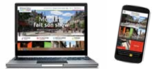
Un site responsive design

Equipé de tout ce dont touristes et locaux peuvent avoir besoin, l'office de tourisme de Moulins et sa région innove avec son nouveau site Internet, Adaptation aux usages mobiles et tablettes, réservation en ligne (billetterie, hébergements...), espaces dédiés (groupes, pros, congrès...), commande de brochures ou encore blog sont au programme de cette nouvelle version, développée par l'agence auvergnate IRIS Interactive. Côté offres touristiques, le site s'appuie sur le Système départemental d'informations touristiques.